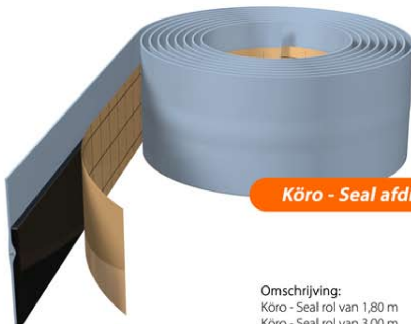
Köro - Seal afdichtband