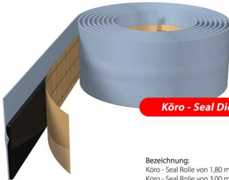
Köro - Seal Dichtband